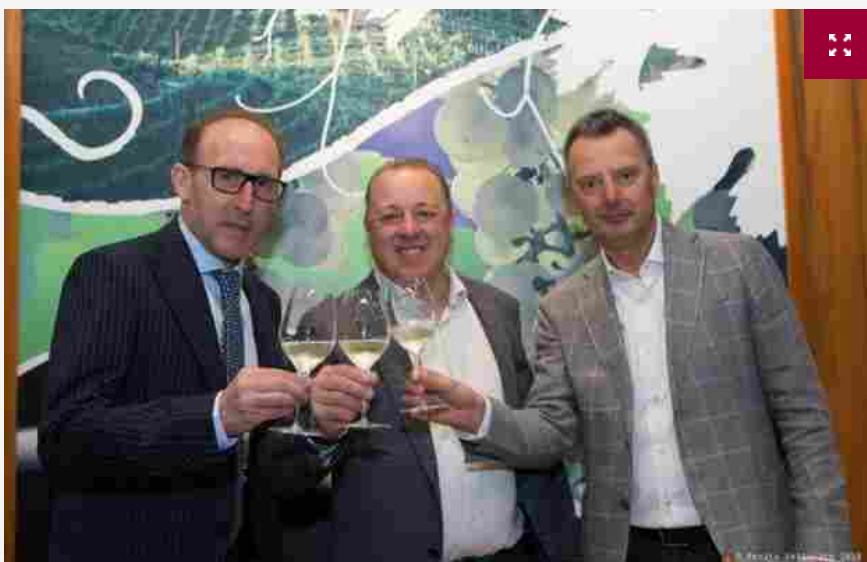
25 magnum di Cartizze per 25 personalità del vino e non: la festa di Col Vetoraz