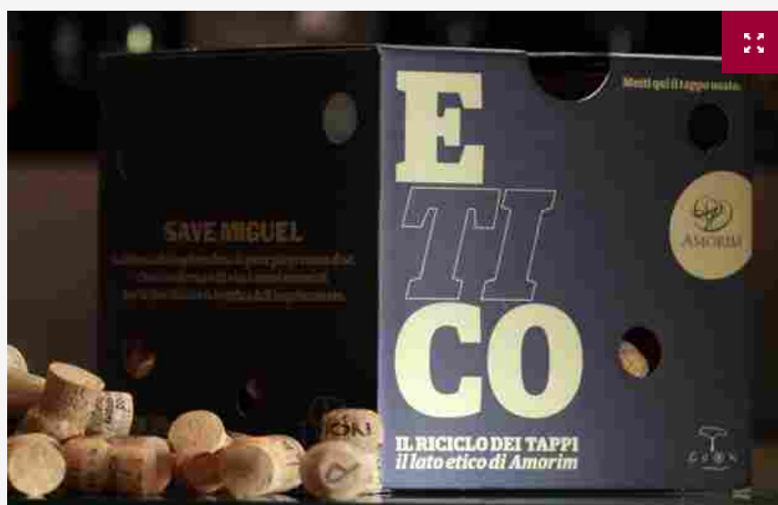
Vino e sostenibilità, Signorvino “a bordo” del progetto etico di Amorim Cork Italia

“Fai attenzione alle piccole cose, perché un giorno ti volterai e capirai che erano grandi”, diceva il mitico leader dei Doors, Jim Morrison. E forse, tra queste, rientra anche la partnership tra Amorim Cork Italia, divisione italiana del colosso portoghese del sughero Amorim (che copre il 40% del mercato mondiale dei tappi di sughero), e Signorvino, la più grande “eno-catena” d'Italia, che conta ormai 16 enoteche in tutta Italia, nata dall'intuizione di Sandro Veronesi, patron di Calzedonia, che diventa partnership del progetto “Etico” di Amorim, nato per riciclare una risorsa preziosa e sostenibile come il sughero.