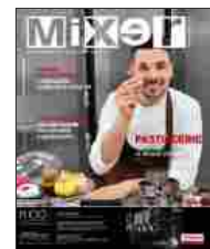
306 - Maggio 2018