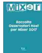
Raccolta Osservatori Host...