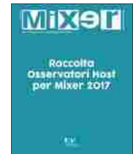
Raccolta Osservatori Host...