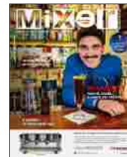
307 - Giugno 2018