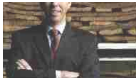
Amorim compra Etablissement Christian Bourrassé 31 Luglio 2017 In "Trend(y)"

E' universalmente riconosciuto che il tappo in sughero è la migliore chiusura per la conservazione delle caratteristiche organolettiche 3 Marzo 2011 In "Trend(y)"