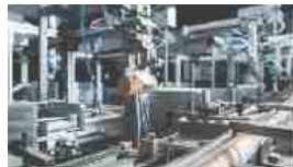
NDtech®, il Supereroe dei tappi in sughero naturale 8 Gennaio 2017 In "Trend(y)"