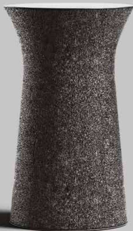
EDY 1650 Tappi riciclati

IL VIRTUOSISMO DEL TAPPO IN SUGHERO. I tappi in sughero usati ritrovano una seconda dimensione trasformati in oggetti di design ad alto contenuto sociale. Pezzi unici prodotti a mano da artigiani italiani grazie alla raccolta delle Onlus associate al progetto Etico di Amorim Cork Italia. La linea Suber è distribuita da Amorim Cork Italia - www.suberdesign.it